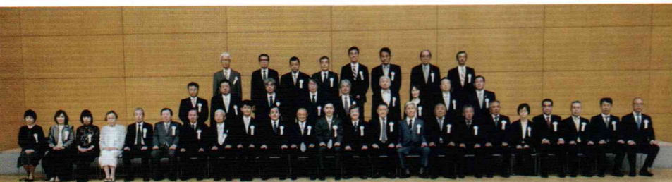
令和6年度憲法施行記念式並びに表彰式 令和6年5月7日 大阪府立国際会議場